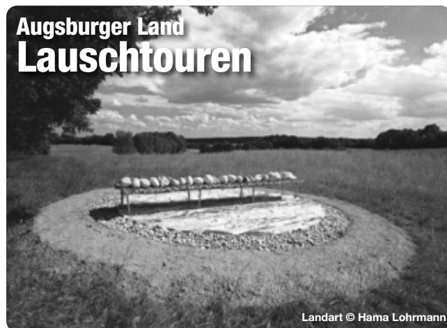
Landart © Hama Lohrmann

Mit dem Audioguide auf den Spuren großer Persönlichkeiten wandern und dabei spannende Erlebnisse und unterhaltsame Geschichten hören. Alles was Sie dafür benötigen ist die kostenlose Bayerisch-Schwaben-Lauschtour App. Mit dem GPS werden die Lauschpunkte automatisch abgespielt – gehen Sie die Tour also in Ihrem eigenen Tempo. Unser Tipp: Die Touren funktionieren auch offline. Am besten lädt man die Tour bereits zu Hause im WLAN herunter.