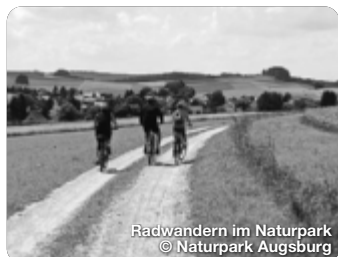
Radwandern im Naturpark

TreffpunktDeutschland.de/augsburger-land