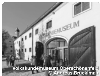
Volkskundemuseum Oberschönenfeld © Andreas Brucklmair