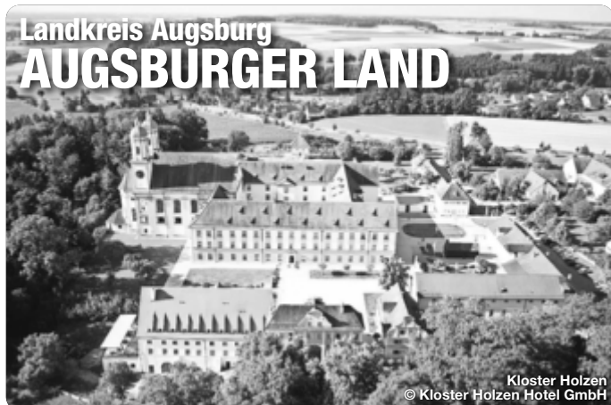
Kloster Holzen

Das Augsburger Land. Mit seiner reichen Geschichte, seiner vielfältigen Kultur und Landschaft ist das Augsburger Land ein attraktives Ziel für ein paar Tage Entspannung. Der Naturpark Augsburg - Westliche Wälder ist die grüne Lunge und lädt zum Naturerlebnis und zur Entschleunigung ein. Die Flüsse Lech und Wertach prägen die Landschaft und bieten zahlreiche Möglichkeiten zum Wandern und Radfahren. Ein vielseitiges Kulturangebot und Freizeitspaß sowie familienfreundliche Angebote und Aktivitäten bei abwechslungsreichen Ausflugszielen bieten ein Urlaubsfeeling im Grünen – ganz ohne Trubel.