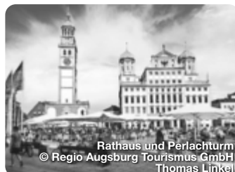
Rathaus und Perlachturm